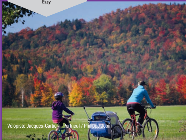
Vélopiste Jacques-Cartier – Portneuf / Philippe Jobin