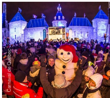
Carnaval de Québec

L'hiver , lorsque la cité revêt son manteau blanc au charme romantique, c'est le moment de vivre des découvertes et aventures inusitées telles que l'Hôtel de Glace, le traîneau à chiens et l'escalade sur glace, sans négliger raquette, ski de fond, ski alpin et motoneige! Au printemps , la cabane à sucre vous invite à savourer les délices de l'érable et à l'automne , les forêts s'habillent de couleurs flamboyantes, autant d'aspects qui font de Québec une destination unique et recherchée.