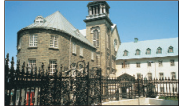
Séminaire de Québec, OTQ

↳ L'histoire du fait français en Amérique. Situé sur le site historique du Séminaire de Québec datant de 1663, le musée d'histoire de Québec fait revivre les moments importants de l'histoire de la civilisation française en Amérique. Horaires : du 24 juin à la fête du Travail, tous les jours, 9 h 30 à 17 h. Septembre à juin, du mardi au dimanche, 10 h à 17 h. Entrée : adultes : 8 $; aînés : 7 $; étudiants (17 ans et plus) : 5,50 $; enfants (12 à 16 ans) : 2 $; (11 ans et moins) : gratuit. Entrée gratuite le mardi entre le 1 er novembre et le 31 mai. Tarifs réduits pour les groupes.