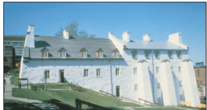
Redoute Dauphine, OTQ