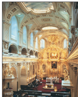
Basilique-Cathédrale Notre-Dame de Québec, Yves Tessier