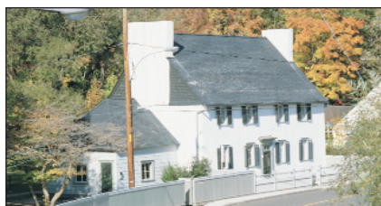
Maison des Jésuites de Sillery, Ville de Québec

1-3 Située sur le site de la première mission fondée par les Jésuites dans le but de convertir et sédentariser les Amérindiens nomades, la Maison des Jésuites de Sillery présente une exposition permanente intitulée « Mission en Nouvelle-France ». L'exposition retrace l'histoire de cette mission, en activité durant le XVII e siècle, et relate la rencontre marquante entre deux peuples aux cultures opposées grâce à plus de 100 objets et artefacts, 40 documents iconographiques, quatre maquettes, trois îlots interactifs, neuf bandes sonores et trois extraits de films reconstituant les témoignages de ceux qui ont vécu cette rencontre marquante. Horaire variable. Entrée gratuite. Tarifs pour groupes avec réservation : 3 $/adulte.