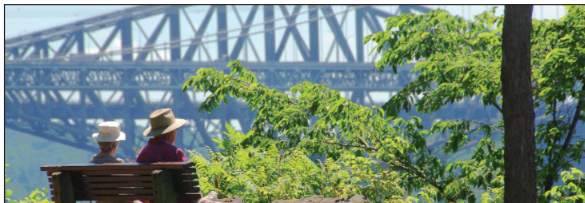
Pont de Québec et Pont Pierre-Laporte, Ville de Québec

Tout à côté, le pont suspendu Pierre-Laporte, le plus long du genre au Canada, le seconde depuis 1970. Il a été bâti en quatre ans. Son tablier est attaché à deux câbles mesurant plus de 0,6 mètre de diamètre. Ils sont constitués de plus de 12 500 fils d'acier qui, placés bout à bout, pourraient encercler le globe terrestre aux trois quarts.