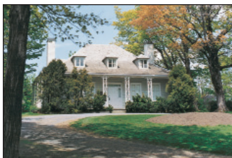
Maison Hamel-Bruneau, Ville de Québec

Horaires variables. Entrée gratuite. Tarif pour groupes avec réservation : 3 $/adulte.