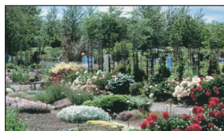
Jardin botanique Roger-Van den Hende

Visites commentées pour groupes seulement sur demande (coût minime).