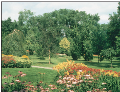
Parc du Bois-de-Coulonge, Christian Sommeiller

👑 Nommé Spencer Wood au début du XIX e siècle, ce domaine devient un haut lieu de l'horticulture en Amérique grâce à son propriétaire Henry Atkinson. Résidence des gouverneurs généraux du Canada-Uni pendant près de vingt ans, la propriété est acquise par le gouvernement du Québec en 1870 et sert de résidence aux lieutenant-gouverneurs jusqu'en 1966. Un incendie majeur dévaste alors la résidence principale. Son emplacement privilégié en bordure du fleuve, la beauté de ses aménagements horticoles et l'empreinte encore visible d'une longue histoire font de Bois-de-Coulonge l'un des parcs publics les plus remarquables de la capitale. Stationnement. Accessible tous les jours.