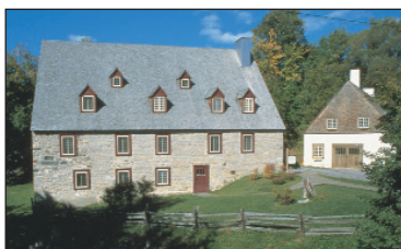
Moulin de La Chevrotière, Brigitte Ostiguy

Horaire : du 24 juin au 30 septembre, tous les jours, 9 h 30 à 17 h 30 et sur réservation à l'année.